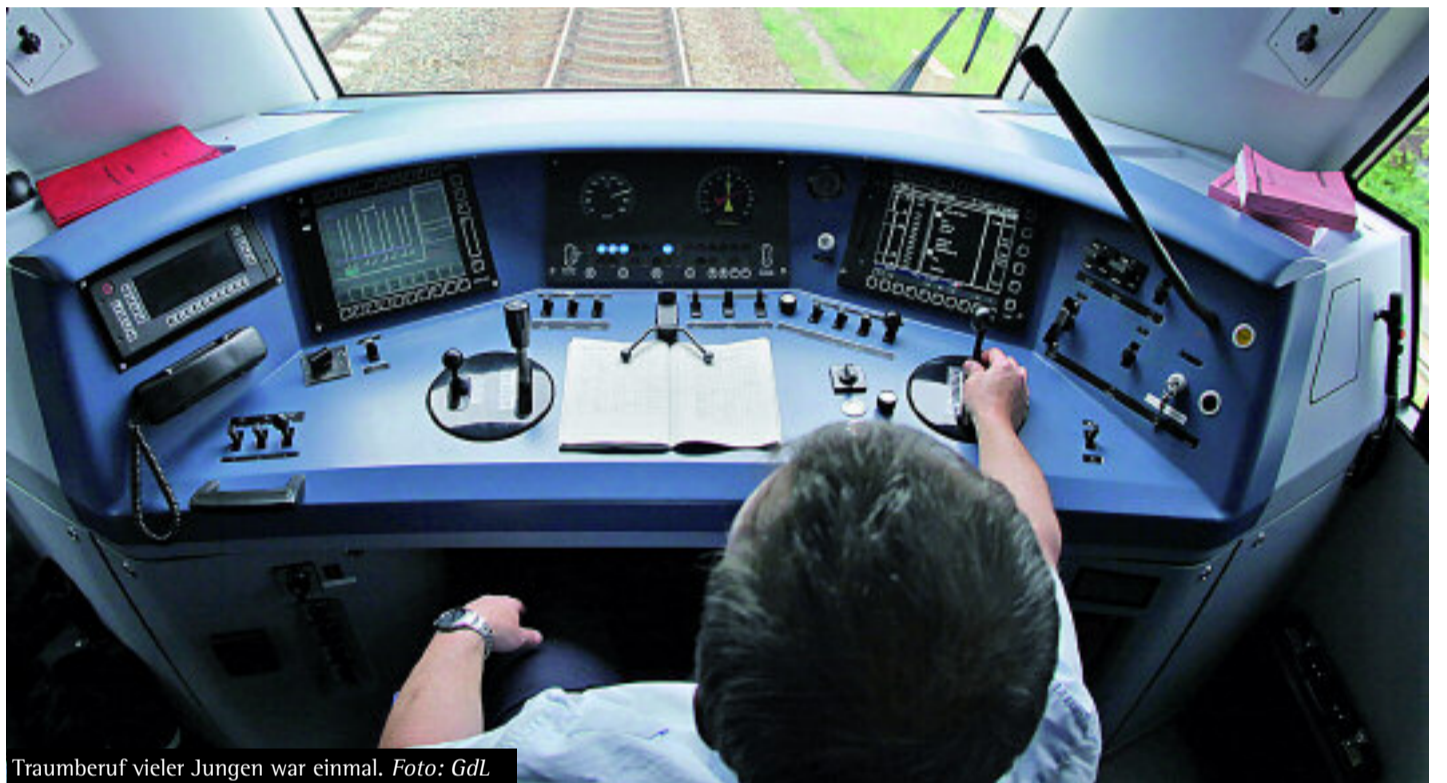
Traumberuf vieler Jungen war einmal.

Vor diesem Hintergrund darf es nicht verwundern, wenn die Forderung nach einer strikten Begrenzung der Überstundenzahl pro Jahr und nach einem Abbau