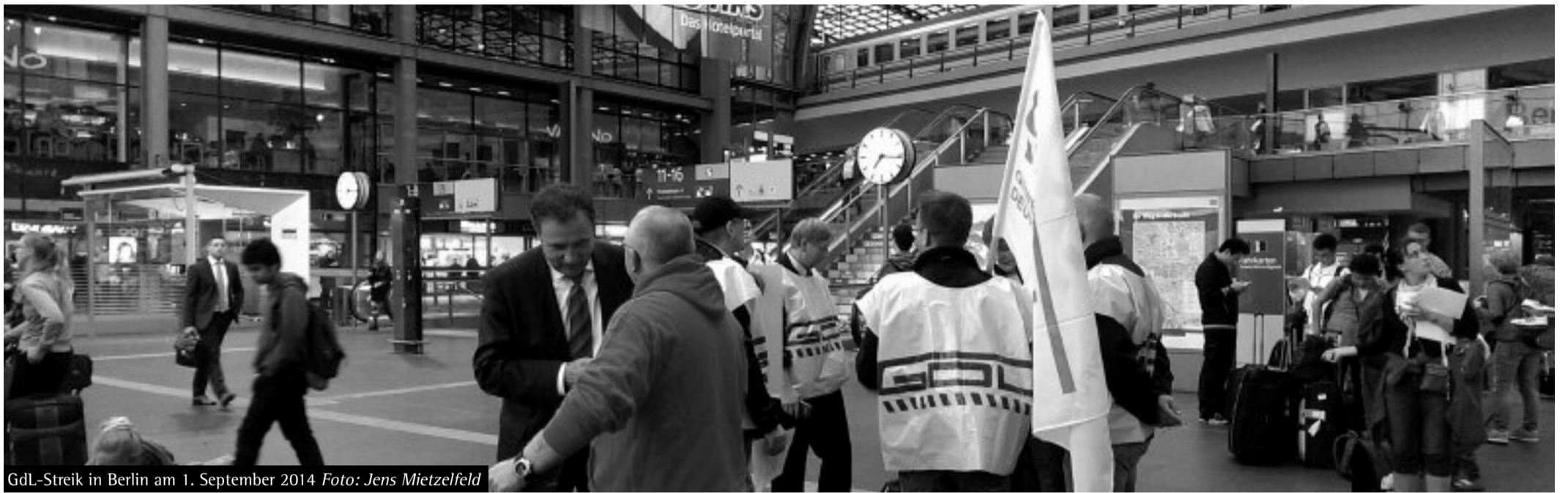
GDL-Streik in Berlin am 1. September 2014

Die öffentliche Debatte um die Streiks der GDL ist geprägt von einer Demagogie, bei der sieben Totschlagargumente eine zentrale Rolle spielen.