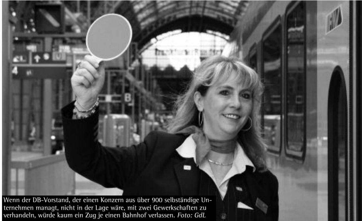
Wenn der DB-Vorstand, der einen Konzern aus über 900 selbständige Unternehmen managt, nicht in der Lage wäre, mit zwei Gewerkschaften zu verhandeln, würde kaum ein Zug je einen Bahnhof verlassen.

Als ehemaliger Gewerkschaftssekretär der damaligen Gewerkschaft Handel, Banken, Versicherungen (HBV im DGB) in Baden-Württemberg war ich von 1979 bis 2001 mit diesem Thema vertraut. Bis 1976 hatten sich in jeder Tarifrunde des Einzel- und Großhandels sowie Buchhandel/Verlage die HBV und die Deutsche Angestelltengewerkschaft (DAG), die nicht dem DGB angehörte, irgendwie über ein gemeinsames Vorgehen mit den Arbeitgebern verständigt. Wegen andauernder Kungeleien der DAG mit den Arbeitgebern erklärte 1976 die HBV-Landesbezirkskonferenz die DAG per Beschluss zur „gegnerischen Organisation“, mit der es keine gemeinsamen Tarifverhandlungen mehr gibt. Das war dann so bis 2001, als HBV und DAG zwei der fünf Gründungs-gewerkschaften von ver.di wurden.