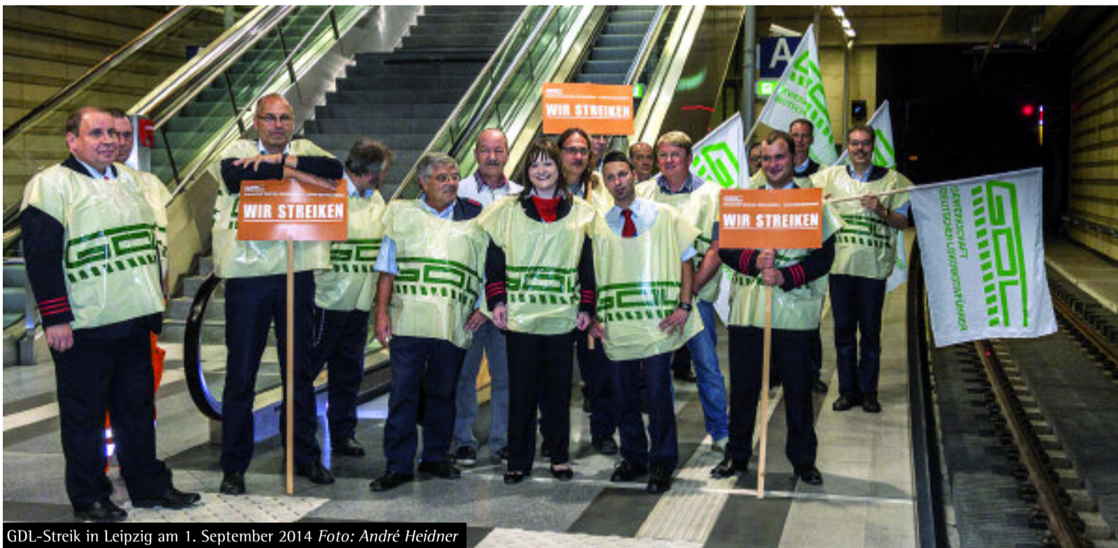
GDL-Streik in Leipzig am 1. September 2014

Können Sie uns mal sagen, was Lumpenjournalismus ist?